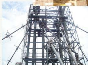
Silos San Pablo